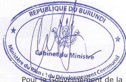
Pour le Gouvernement de la République du Burundi Pierre MUIRA, Ministre du Plan et du Développement Communal